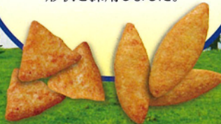
チーズせん 焼もろこしせん