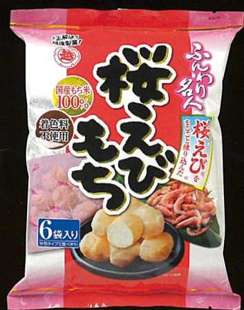
ふんわり名人桜えびもち