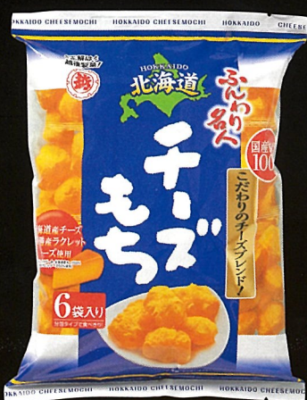
ふんわり名人北海道チーズもち